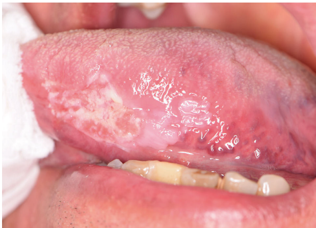
Figura 1. Carcinoma de cavidad oral en borde izquierdo de lengua en relación con leucoplasia (mancha blanquecina)

Publicado con consentimiento del paciente.