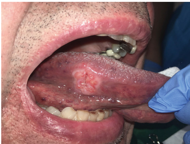
Figura 4. Carcinoma de cavidad oral en borde de lengua

Tumor tamaño T1, \leq 2 cm diámetro mayor, asociado a dolor espontáneo y exacerbado a la palpación. Publicado con consentimiento del paciente.