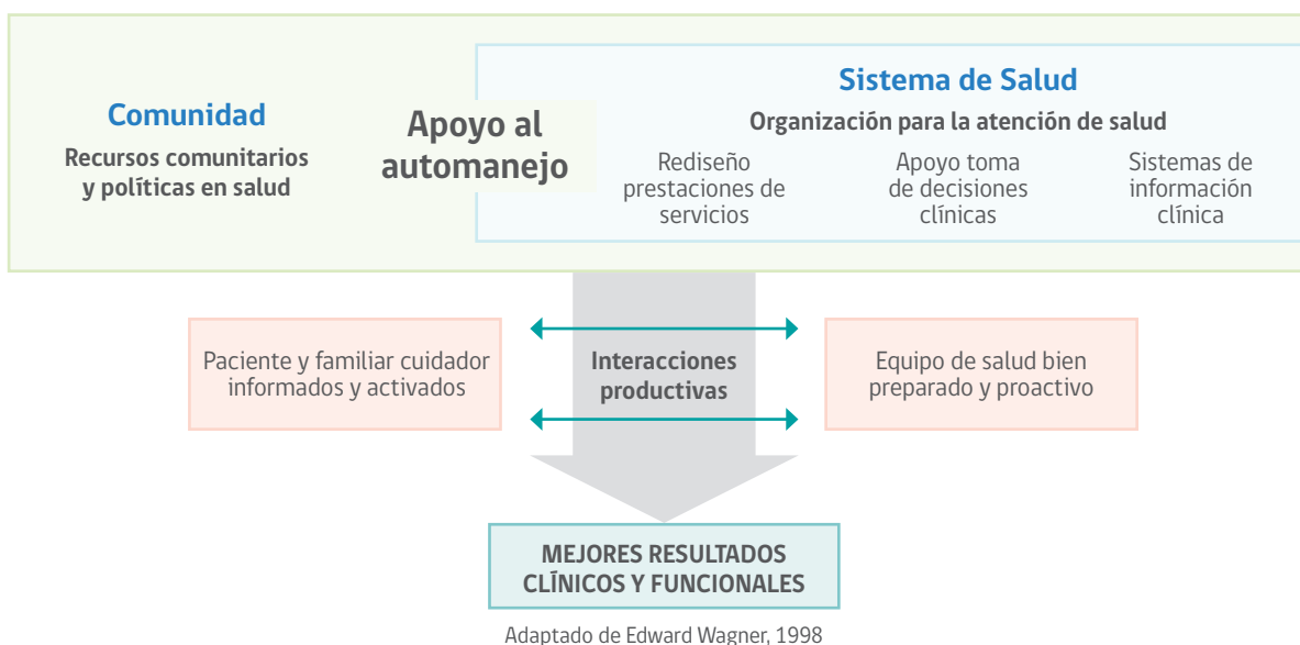
Figura 1: Esquema del Modelo de Cuidados Crónicos