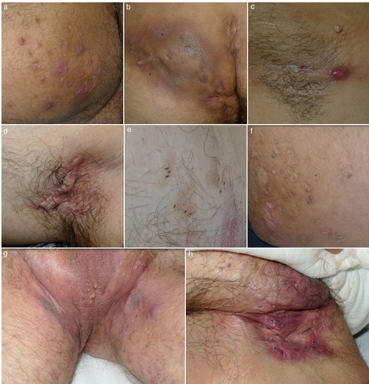
Figura 1 Imágenes clínicas de la hidrosadenitis supurativa. a) Nódulos inflamatorios localizados en la cara interna del muslo derecho. b) Gran absceso y fístula crónica que ocupa la nalga derecha. Destaca la hiperpigmentación de la nalga afectada. c) Fístula lineal en fase inicial. Se aprecia un nódulo inflamatorio y un sinus drenante localizado en la axila de una mujer de 22 años. d) Cicatriz en puente en axila izquierda. e) Dobles y triples comedones. f) Cicatrices atróficas tipo «boxcar». g) Hidrosadenitis de predominio folicular con presencia en el área inguinogenital de numerosos quistes, nódulos inflamatorios y abscesos. Llama la atención el eritema y edema que envuelve toda el área afectada. h) Cicatrices y fístulas drenantes en ingle derecha.

las ingles, b) objetivar la presencia de alguna de las lesiones consideradas típicas, incluyendo nódulos dolorosos o abscesos o sinus supurativos o cicatrices y c) que el curso de la enfermedad presente múltiples recurrencias 12 . En la mayoría de los casos, salvo sospecha de complicación o dudas diagnósticas, no realizaremos tomas de biopsias ni tomas de cultivo.