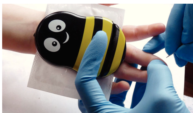
FIGURA 2. DISPOSITIVO BUZZY®

Se aplica proximal al sitio de punción, en este caso lanceta para toma de muestra capilar. El efecto analgésico se obtiene al combinar frío y vibración emitida por el dispositivo.