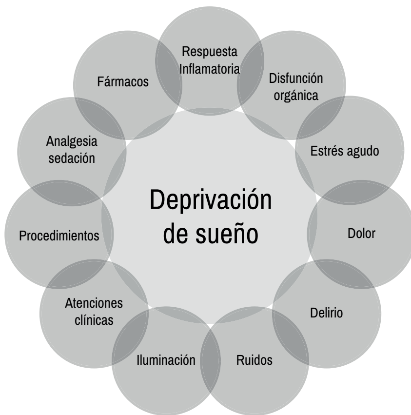
Figura2: Determinantes fisiopatológicos y ambientales de la privación de sueño en la UCI.